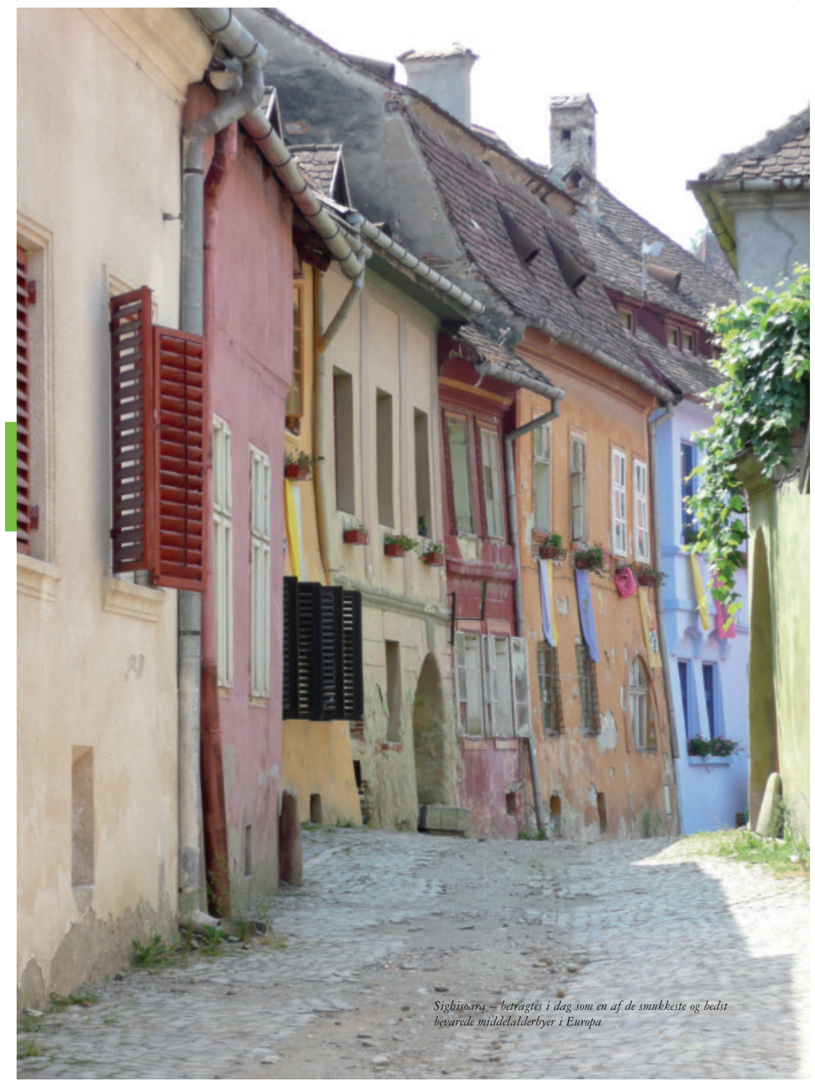
Sigheoara – betragtes i dag som en af de smukkeste og bedst bevarede middelalderbyer i Europa